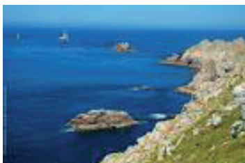
La pointe du raz