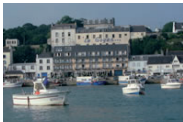
Port d'AUDIERNE A 1.5 km