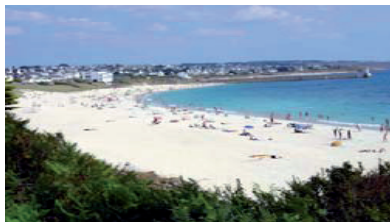
Plage d'AUDIERNE A 1.5 kms